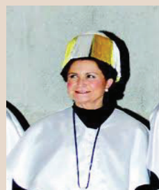
Investidura Doctor Honoris Causa IPADE 2010