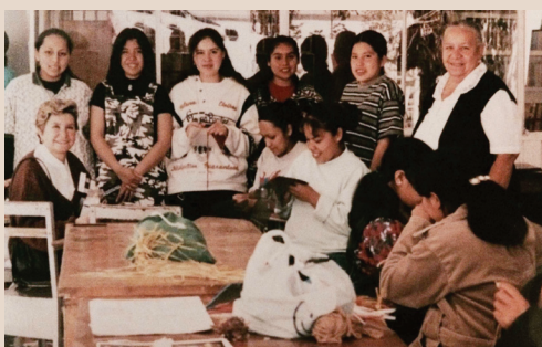
Visita a mamás embarazadas 1994