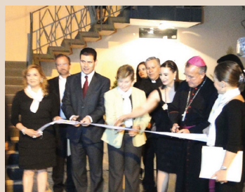
Bendición VIFAC Zacatecas 2009