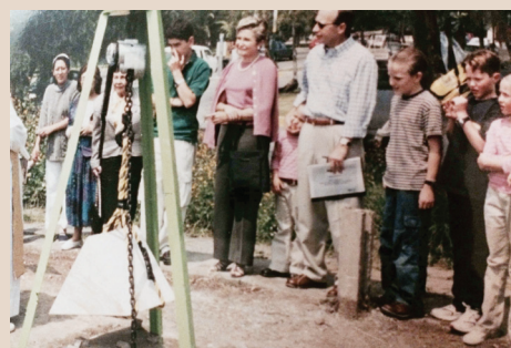
Primera piedra Casa Azul 2001