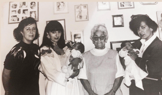
Cunero Científicos 1987