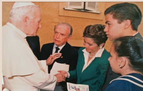
Visita a San Juan Pablo II Roma 1988