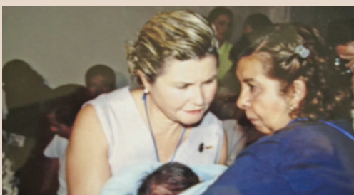
Entrega de bebé VIFAC México 2005